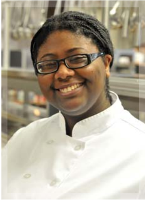
YSSA MEH HEREAUX